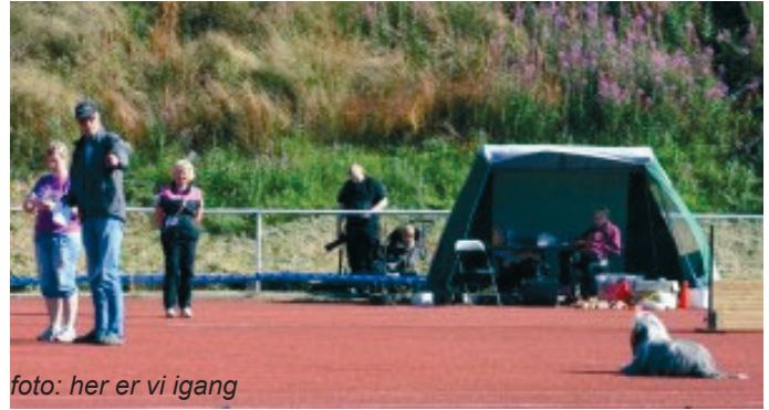
foto: her er vi igang