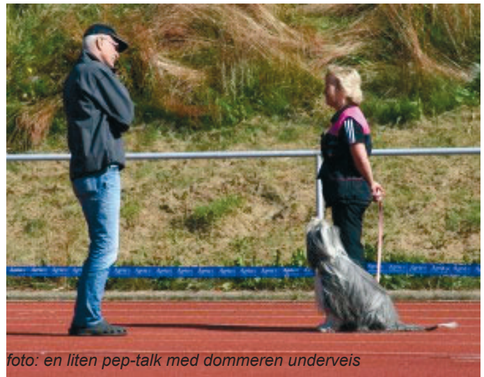
foto: en liten pep-talk med dommeren underveis